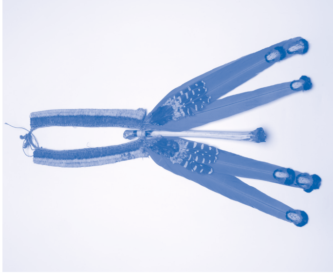
Ceremoniële borstversiering voor mannen (Wirahukang), Brazilië, ca. 1950. Been, katoen, veer. Museum Volkenkunde, Leiden.

Het Ka'apor volk uit het noordoostelijk Amazonegebied noemt zichzelf Ka'apor. Van oudsher worden deze mensen in onze literatuur en database echter Urubú genoemd, wat 'aasgieren' betekent. Deze naam kregen ze van hun Lusobraziliaanse vijanden, tegen het einde van de 19de eeuw. Hoewel de Ka'apor 'Urubú' als een negatieve benaming zien, wordt de term in de literatuur tot op heden gebruikt. Vrijwel alle volken uit het Amazonegebied staan voor vergelijkbare uitdagingen.