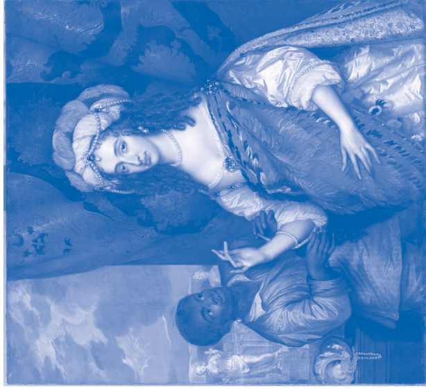
Adriaen Hanneman, Postuum portret van Maria I Stuart met een dienstbode , ca. 1664. Olieverf op doek. Mauritshuis, Den Haag.