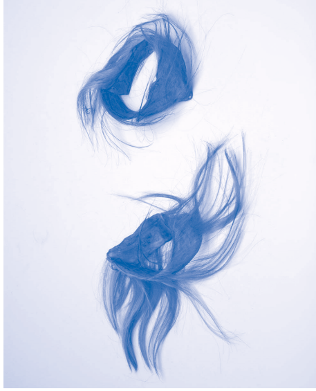
Paar kuitbanden, Indonesië. Voor 1889. Huid, rotan. Koninklijk Zoölogisch Genootschap Natura Artis Magistra. Tropenmuseum, Amsterdam.

Bij de registratie en documentatie van objecten wachten ons talloze uitdagingen. Ongetwijfeld verschillen die voor verschillende musea en collecties. Natuurlijk hebben wij, net als andere musea, problemen met verouderde en beledigende termen; we zouden zelfs kunnen stellen dat dit soort uitdagingen binnen de etnografische musea groter zijn dan bij de meeste andere musea. Ik wil het echter hebben over andere subtiele maar belangrijke kwesties, eveneens gerelateerd aan tijd en perspectief: de juiste keuze voor het gebruik van bijvoorbeeld de tegenwoordige of verleden tijd bij het beschrijven van objecten, en het gebruik van verkleinwoorden.