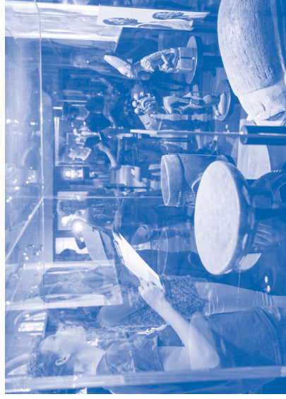
Rondleiding in het Tropenmuseum, 4 juni 2015

Binnen educatieve programma's gaat het niet alleen om woorden die gevoelig of discriminerend zijn, waarvan er meerdere in deze publicatie besproken worden. Soms kan de problematiek rondom taal veel subtieler en onverwacht zijn en wordt een doodgewoon woord gecompliceerd.