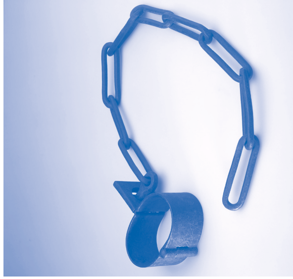
Voetboei. Suriname. Begin 19e eeuw. Smeedijzer. Tropenmuseum, Amsterdam.

Als ik voor het Nationaal Museum van Wereldculturen schrijf over slavernij en kolonialisme, ben ik blij met de keuze van het museum om standaard te spreken over ‘tot slaaf gemaakte personen’ als het gaat om mensen wiens vrijheid met geweld ontnomen is. Het gebruik van ‘tot slaaf gemaakt’ in plaats van ‘slaaf’ erkent de slavernij als een daad van macht en ontmenselijking, in plaats van de persoon eenvoudig in een sociale categorie in te delen. Ik worstel echter nog steeds met namen voor voorwerpen die gebruikt werden om mensen tot slaaf te maken. Termen als ‘slavenschip’ en ‘slavenband’ (maar ook een woord als ‘slavendrijver’) bevatten het woord ‘slaaf’, maar refereren niet direct aan een persoon die tot slavernij gedwongen wordt. Toch voelt het gebruik ervan onprettig.