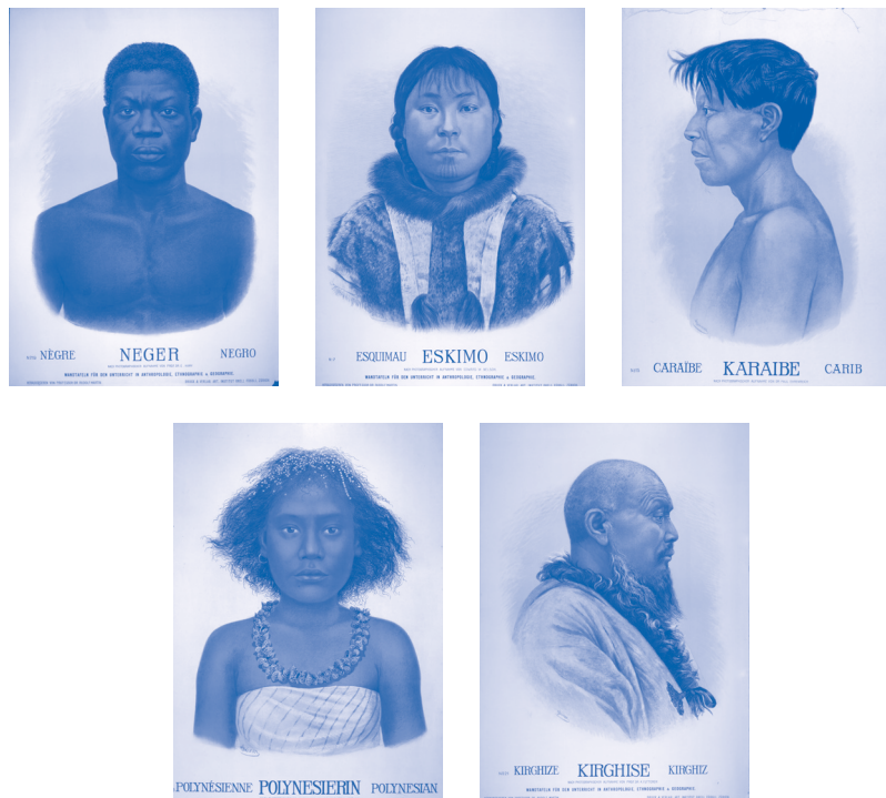
Wandplaten voor onderricht in de antropologie, etnografie en geografie, door W. von Steiner (naar foto van prof. dr. M. Futterer), ca. 1905, kleurenlithografie op papier, Tropenmuseum, Amsterdam.